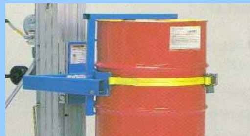
Basculer de fût